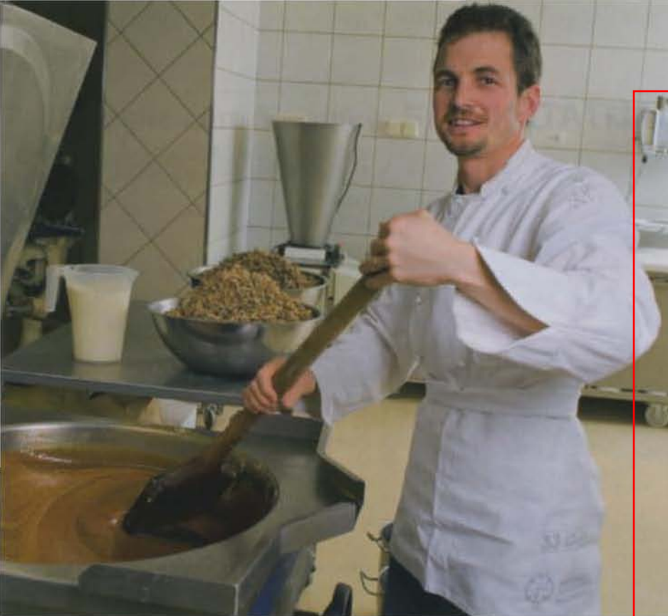
NUSSTORTE: In der Bäckerei Giacometti wird die Füllung mit grosser Kelle angerührt.