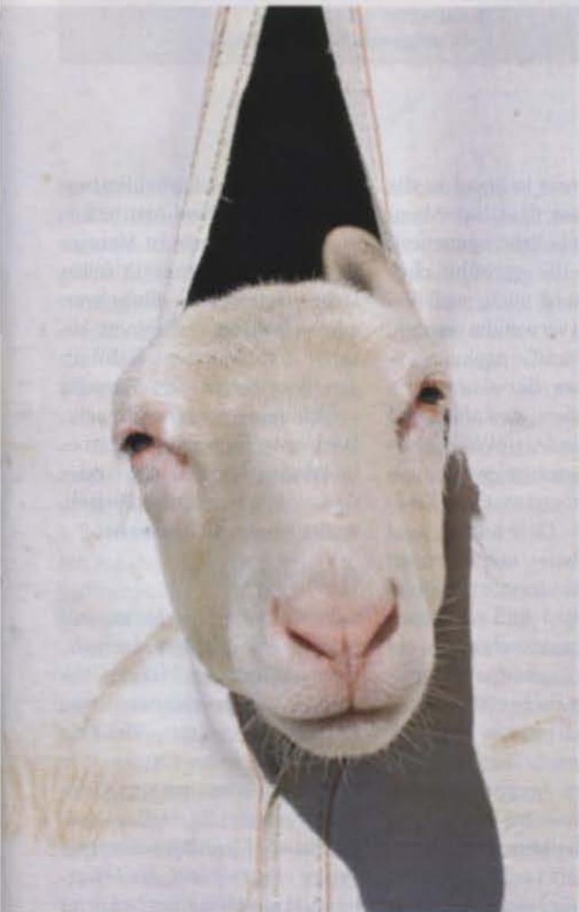
MITBEWOHNER: Im Unterengadin sind Schafe ein wichtiger Teil des Lebens.